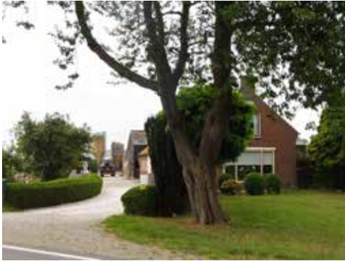
Philippus Hoeve