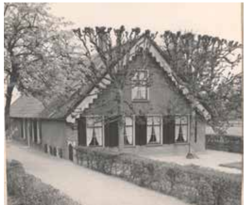
Nieuwe Zandweg 44